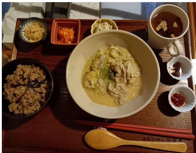
<ランチセットの一例>