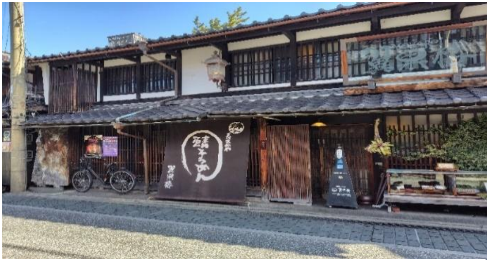
築200年の店舗正面からの写真

JR長浜駅より北国街道を北へ歩いて10分。店は築200年以上の商家を改装した建物です。表通りからではなく、横の路地の方に入口がありました。予約が出来ないので土日は行列ができるようですが平日なので並ぶことなく入店できました。小さな部屋や急な階段を登る二階もある古い雰囲気の落ち着いたところでした。