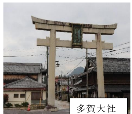
多賀大社 一の鳥居